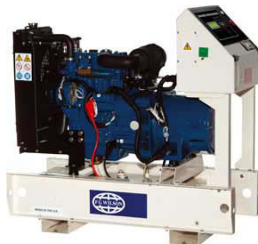
Imagen con finalidad ilustrativa únicamente